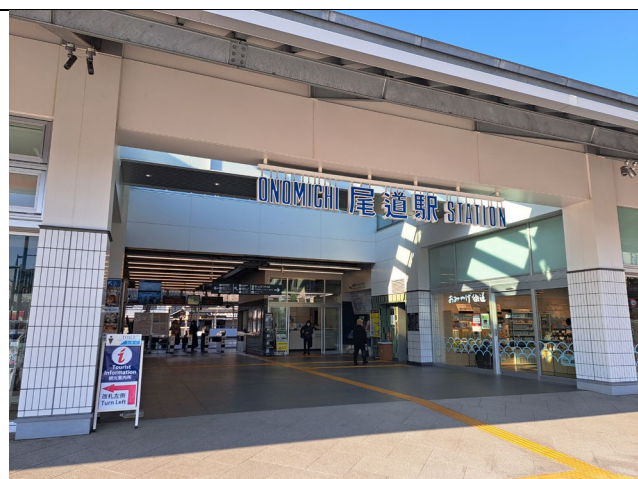
尾道駅南口 (奥へ入り、左が階段、右がエレベーター)