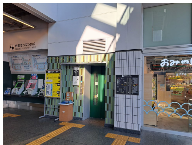
尾道駅からのエレベーター