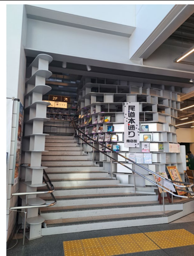
尾道駅舎内の 2F への階段