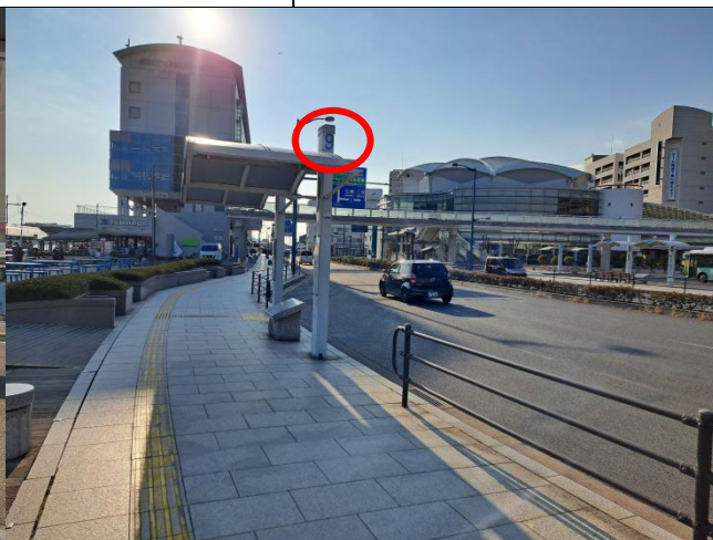
バス停 9 番 (乗降場所)