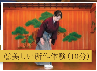
②美しい所作体験(10分)

謡(うたい)の発声法で本来の自分の声を出してみたり、能の所作から美しく見える立ち居やお辞儀を体験します。